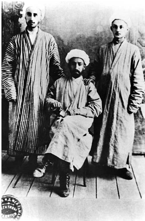
Fitrat (o'tirgan) shogirdlari bilan

Nasriy ijodi. O'tgan asrning 10-yillarida sahna asari sifatida namoyish etilgan «Munozara» Fitratning nasrdagi ilk asaridir. «Munozara» ham, «Sayyohi hindi» ham Fitrat publitsistikasining yorqin namunalaridan. Fitrat keyinchalik ham ijtimoiy, huquqiy, ma'naviy hamda estetik qarashlarini ifodalashda publitsistikadan samarali foydalandi. Faqat 20-yillarning o'rtalariga kelibgina u «sof» nasriy asarlarni yarata boshladi («Qiyomat», «Me'roj», «Oq mozor», «Zayd va Zaynab», «Zahroning imoni» va b.). «Munozara» va «Sayyohi hindi» asarlarida ko'tarilgan milliy qoloqlik, diniy fanatizm mavzusi 20-yillar uchun ham dolzarb ahamiyatga ega edi. Fitrat bu hikoyalarida diniy syujetlardan jaholat ta'siriga qarshi kurashda foydalandi. Bu asarlar, ayniqsa, 1930 yilda qayta ishlagan «Qiyomat» xayoliy hikoyasi hozirgi o'zbek adabiyotida fantastikaning tug'ilishi va shakllanishida milliy manba bo'lib xizmat etdi.